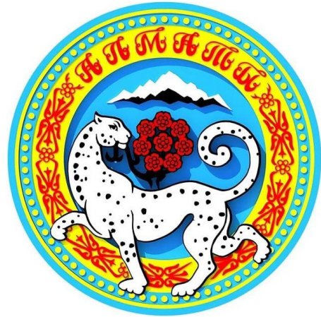
Акиматы городов Государственные проекты